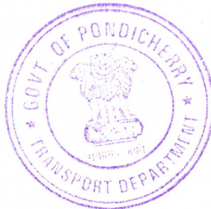
(S.D. SUNDARESAN) TRANSPORT COMMISSIONER

The suggestion can also be sent by e-mail. The e-mails with suggestion may be sent to tc.pon@nic.in